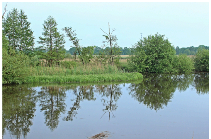
Im Naturschutzgebiet des Flusslaufs Aper Tief

Eine Kolonie Rabenkrähen schafft eine Geräuschkulisse wie bei Hitchcocks Film „Die Vögel“! Weiter geht es, dem aufziehenden Gewitter davonfahrend, am Jümme See entlang – auch dort ließe sich nett einkehren oder baden. Apropos „baden gehen“: Weil der Knotenpunkt 92 auf unserer Karte genau in einer Falz liegt und uns einen Übergang über die Jümme vorgaukelt, den es hier nicht gibt, fahren wir erst einmal falsch, bzw. anders als ursprünglich beabsichtigt.