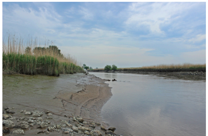
Am Ufer der Jümme ist das Süßwasserwatt des

Zuerst konnte man sehen und hören, wie das Wasser mit für Tieflandflüsschen ganz ungewöhnlicher Schnelligkeit Richtung Ems und Nordsee strömte, in munteren Wirbeln gurgelnd und glucksend. Äste, Zweigwerk und zu flachen Placken zusammengeballtes Heu schwammen flott vorbei. Wir warteten dort, an der Pünfte Wiltshausen, auf die älteste handbetriebene Fähre Deutschlands. Tidebedingt, so hieß es auf einer Tafel, führe die nächste Fähre um 12.25 Uhr. Jetzt war es kurz vor zwölf. Auf einer der hölzernen Bänke, die dort für die Wartenden am Ufer aufgestellt sind, hatten wir uns niedergelassen.