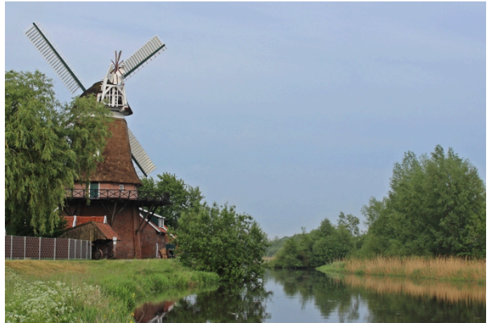
Direkt am Flussufer liegt die Hengstforder Mühle mit dem beliebten Landgasthof