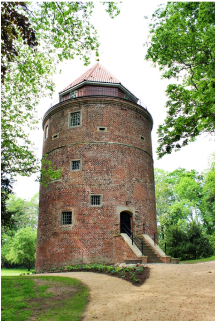
Im Schatten des Burgturms von Stickhausen

nächsten, vorbei an einer hochaufragenden Skulptur, die dem Fahrradfahren gewidmet ist, bis zur oben bereits beschriebenen Fähre.