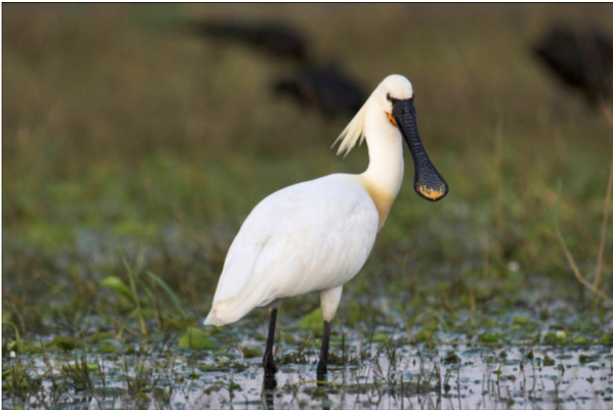
Ein Löffler in den Langeooger Salzwiesen

hochspezialisierte, salztolerante Pflanzen- und Insektengemeinschaften. Strandgrasnelke und Strandflieder setzen mit ihren Blüten Farbakzente. Auch brüten hier Charaktervögel der Nordseeküste wie Austernfischer, Rotschenkel u. a. Seit einiger Zeit findet sich auf Langeoog in den Salzwiesen vorm Vogelwärterhaus auch alljährliche eine Kolonie der exotisch wirkenden Löffler ein: wohl infolge der Renaturierung von 218 ha Salzwiesen durch die Öffnung des alten Sommerdeichs. Die Wiesen werden jetzt wieder häufiger überspült. Der vorhandene Weg zur Meierei ist als neuer Sommerdeich ausgebaut worden. Ein weiteres gelungenes Beispiel für einen ökologischen, naturverträglichen Küstenschutz auf der autofreien Insel Langeoog.